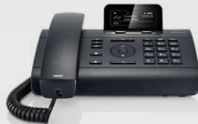
Gigaset DE310IP PRO

De volgende Gigaset pro IP-bureautelefoons zijn beschikbaar voor directe aansluiting op de Hybird 120: