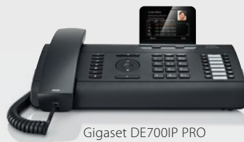
Gigaset DE700IP PRO