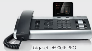
Gigaset DE900IP PRO