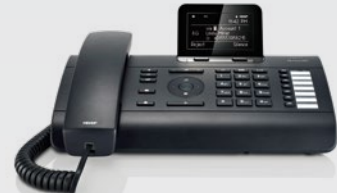
Gigaset DE410IP PRO