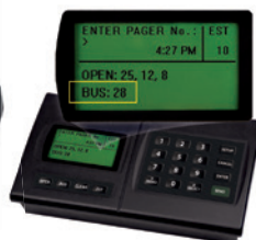
De IQBase transmitter