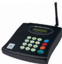
LTKK basic transmitter