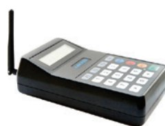
Mini TX transmitter

uw personeel. Geen lange gebruiks aanwijzingen, maar simpele en efficiënte functies zorgen voor een probleemloze werking.