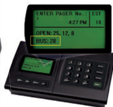
De IQBase transmitter