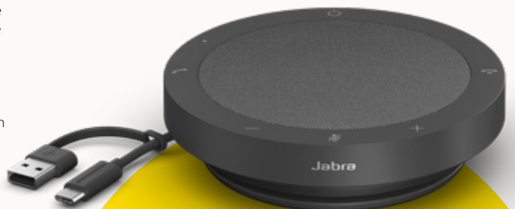
MS TEAMS- EN UC-VARIANTEN

Om een bijdrage aan de bescherming van onze planeet te leveren, denken we in elke fase van de productontwikkeling aan duurzaamheid. De buitenkant van de Speak2 40 is gemaakt met meer dan 50% duurzame materialen** en beschikt over een aantal ingebouwde onderdelen die kunnen worden gerepareerd of vervangen. Betere duurzaamheid = langer meegaande luidsprekers = nog jarenlang geweldige gesprekken voor jou en je team.