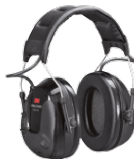
3M™ PELTOR™ ProTac™ III Slim Headset