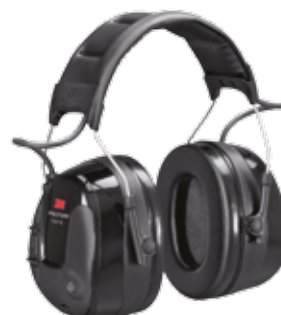
3M™ PELTOR™ ProTac™ III Headset

Gehoorbescherming met externe audio-ingang